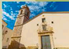
Església Sant Jaume